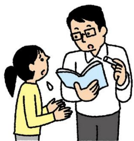
担任の先生に ことわってからくる