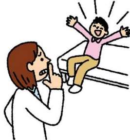
保健室ではさわがず しずかにすごす