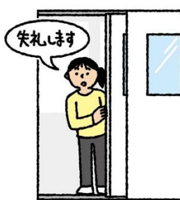
入室退室時には あいさつをする だれかと一緒に来てね