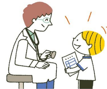
自分の順番になったら 校医の先生にきちんと挨拶する