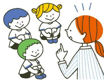
当日も先生の説明をしっかりと聞く