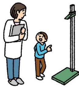
室内の備品などに 勝手にさわらない

保健室に来たときは、「いつ」「どこで」「何を」 して、「どうなったか」を教えてください。 どんな手当てをするかを決めたり、手当てのあ とにどうするかを考へたりするために大切な 情報です。気持ちが落ち着いてからでかま いせん。教えてくださいね。