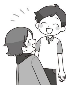
友だちと仲良くできた