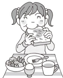
朝ごはんを食べた