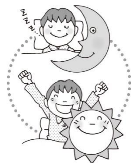
早寝早起きをした

みんなの1年間はどうか？健康について1年を振り返り、体と心を整えて、新しい学年のスタートに備えましょう。